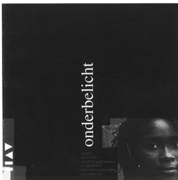
Uitgave bij de tentoonstelling Onderbelicht, A. Roepman (red.), Onderbelicht. Zwarte migranten vluchtelingenvrouwen in Nederland, informatie-uitwisseling in perspectief. IIAV, 1996.

Voor de verwerving van archieven en beeldmateriaal is 'zmv' eveneens een zwaartepunt geworden. Om te voorkomen dat archieven van belangrijke zmv-organisaties en -personen verloren gaan, is in 1994 een brief gestuurd aan vijftig potentiële archiefschenkers. Sindsdien heeft het IIAV daadwerkelijk enkele archieven geacquireerd, zoals het archief van de Landelijke Vereniging van Alleenstaande Arabische vrouwen. Het IIAV bepaalt op dit moment welke archieven van welke organisaties en personen het graag wil hebben. Daarna zal met de betreffende organisaties en/of personen contact worden gelegd, om hulp te bieden bij de archiefvorming en afspraken te maken over de overdracht van hun archief (inclusief publicaties en beeldmateriaal) in de toekomst.