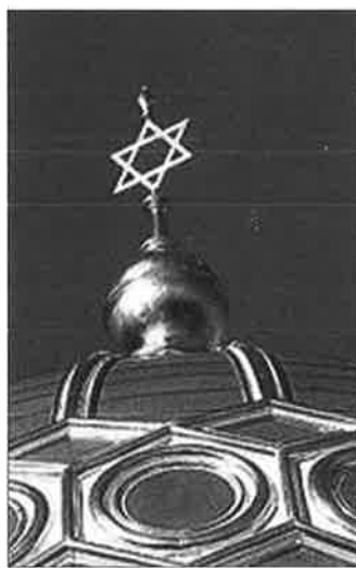
Oranienburger Strasse in Berlijn, het hart van de oude Joodse wijk. Middelpunt is de gedecimeerde synagoge met zijn onlangs met bladgoud bedekte uivormige koepels.

de 1900-1940, volgde een groot project over de Zeeuwse watersnoodramp. Ook hier gaat het over trauma's. "Die aandacht voor trauma's heeft te maken met mijn afkomst; ik ben opgegroeid in een getraumatiseerde wereld. Maar ook identiteitsvorming interesseert me. Hoe geven mensen vorm aan hun leven? Er is een verband tussen de belevingswereld van de joodse vrouwen van mijn en de vorige generatie en de vrouwen achter de sluiers van mijn islamproject. Die vrouwen verkennen hun grenzen en proberen ze naar hun hand te zetten."