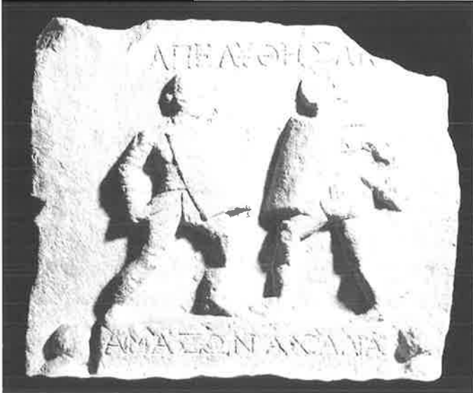
afbeelding 2: Marmeren reliëf uit de eerste of tweede eeuw n.C. afkomstig uit Halicarnassus in Asia Minor, het huidige Bodrum in Turkije

worden ze regelmatig beschreven door verschillende auteurs. Ze presenteren de deelname van vrouwen overigens niet als iets nieuws, waaruit we kunnen opmaken dat vrouwen waarschijnlijk al eerder vochten als gladiatoren. Onder Nero zijn er drie voorbeelden bekend. De Griekse geschiedschrijver Dio Cassius (ca.155-235 n.C.) beschrijft onder andere de munera die Nero ter ere van zijn moeder Agrippina hield te Rome in 59 n.C.. Een munera is een verplichting jegens een dode voorvader, meestal in de vorm van gladiatorenspelen. Munera werden enige tijd na de begrafenis gehouden en vaak jaarlijks of vijfjaarlijks herhaald. Dio vond het zeer shockerend dat er zowel mannen als vrouwen uit zowel de ridder- als de senatorenstand aan meededen. Zij speelden fluit, participeerden in pantomimes, menden paarden, doodden wilde dieren en vochten als gladiatoren.