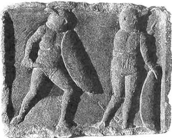
afbeelding 1: grafmonument